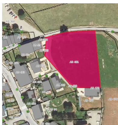
Parcelle de la Tour